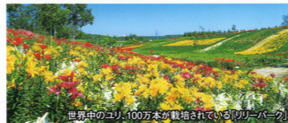
世界中のユリ、100万本が栽培されている「リリーパーク」