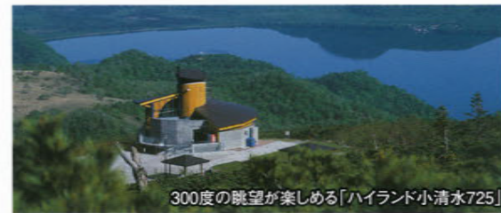
300度の眺望が楽しめる「ハイランド小清水725」