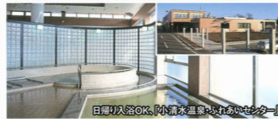
日帰り入浴OK、「小清水温泉ふれあいセンター」